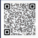
ក្នុងប្រទេសសិង្ហបុរី

ស្វែងរកទីនេះសម្រាប់ព័ត៌មានបន្ថែម ស្តីពី RHB Premier Banking Lounge