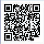
ក្នុងប្រទេសម៉ាឡេស៊ី